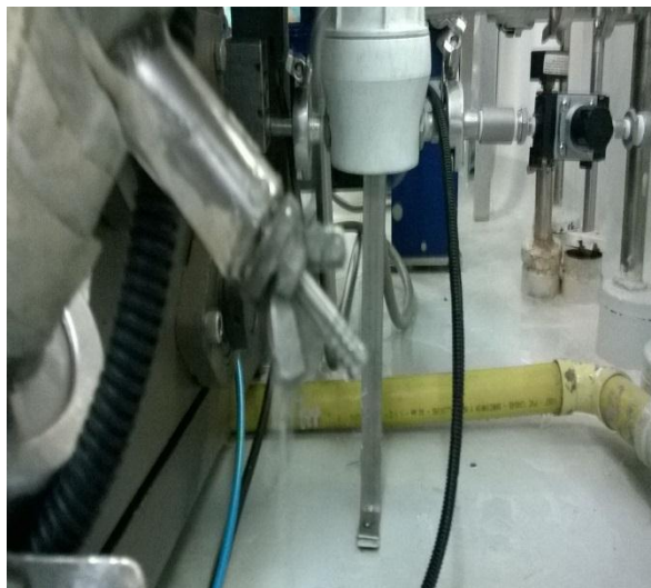
Foto No. 2 Área lavado de frascos