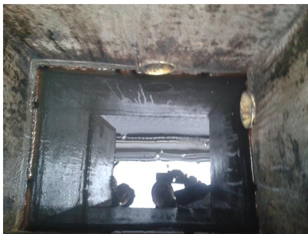
Foto No. 3. Caja de inspección externa KR 43 A